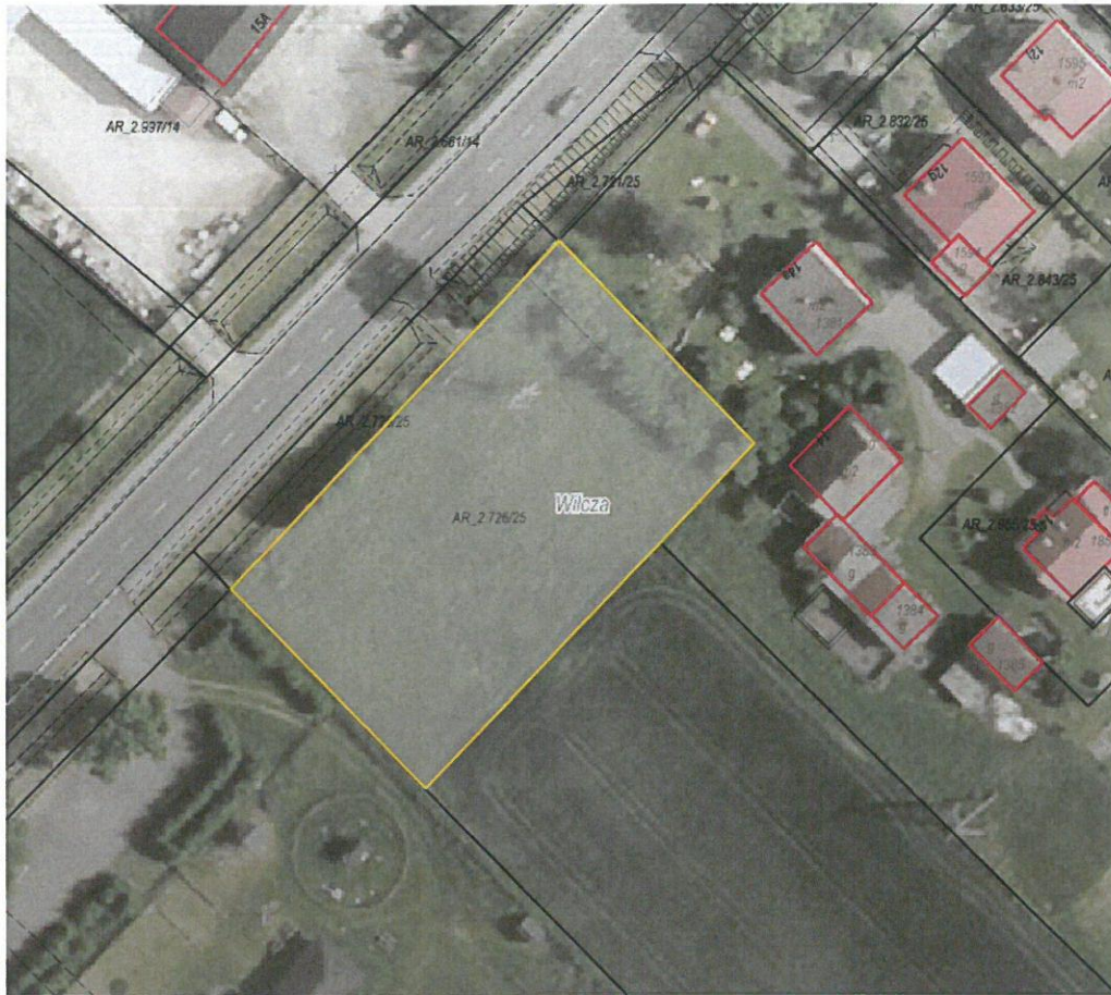
Rysunek 1 Działka przeznaczona do sprzedaży zaznaczona kolorem żółtym