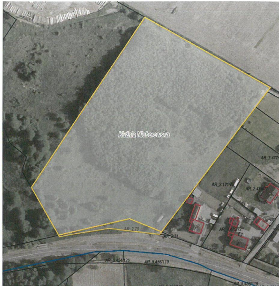
Rysunek 1 Działki przeznaczone do sprzedaży zaznaczone kolorem żółtym