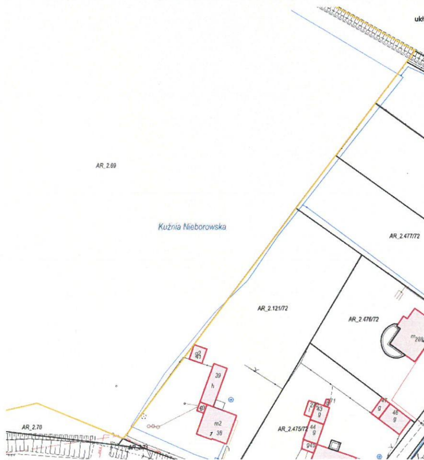
Rysunek 2 Fragment mapy z uzbrojeniem terenu